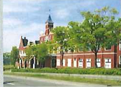
錦ヶ丘ヒルサイドモール