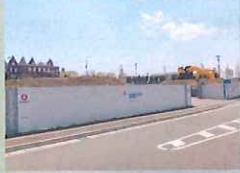
スーパー＆ドラッグ (2021年度OPEN)